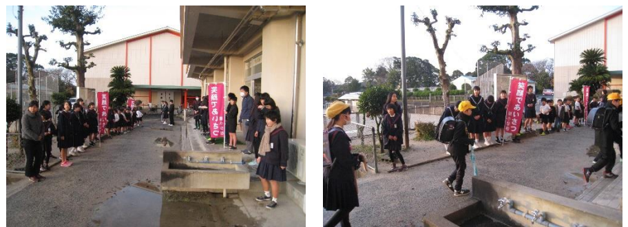
【麓小学校での様子】

今年度2回目ということもあって、中学生と一緒に元気よくあいさつ運動に取り組みました。先輩達が笑顔であいさつをしてくれるので、小学生も自然と笑顔になりました。