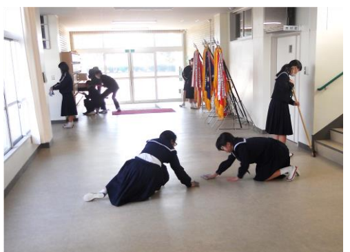
無言掃除の様子（西中）

また、あいさつ運動の他にも、「応援メッセージの交換」「部活動の見学・体験（西中入学説明会時）」「ようこそ先輩」等を通して小中の交流を深めました。先輩達の成長した姿を見たり、優しく声をかけてもらったりしたことで、6年生にとっては、中学校をより身近に感じることができ、進学への希望や期待が膨らみました。