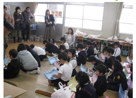
麓小での授業研究会

1月23日（木）には、麓小学校を会場に3校合同の授業研究会を行いました。授業後に、各学年や部会に分かれて協議会をもち、その中で、小学生や中学生の実態について情報交換を行い、よりよい授業づくりについて意見を交流しました。夏休みの研修会が台風で中止になるなど、計画よりもあまり取り組めないこともありましたが、鳥栖西中学校、旭小学校、麓小学校の教職員が、児童生徒の学力向上に向けて、一緒に研修をしたり情報を共有したりすることで「小中一貫教育」を具体的に進めることができている。